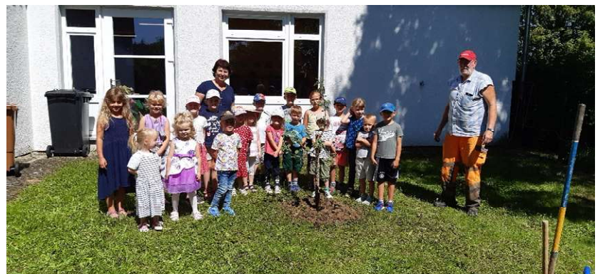
Wir pflanzen einen Apfelbaum