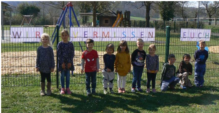
Notbetreuung Wir vermissen euch