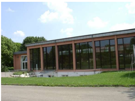
Turn- und Festhalle Großaltdorf