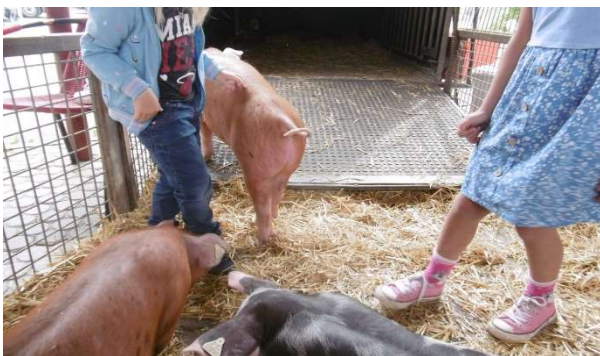
Besuch der Schweineschule Aktion des Elternbeirates